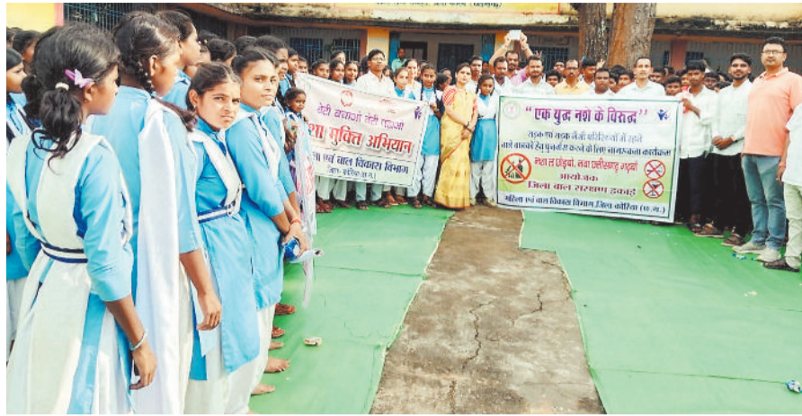
नशा मुक्त भारत अभियान जागरूकता कार्यक्रम

19 सितंबर के कार्यक्रम में उपस्थित महिलाओं को महिला एवं बाल विकास विभाग के योजनाओं के विषय में जानकारी जैसे चाइल्ड हेल्प लाइन 1098, महिला हेल्प लाइन 181, स्पॉन्सरशिप योजना, सखी वन स्टॉप सेंटर, घरेलू हिंसा अधिनियम 2005, लैंगिक उत्पीड़न, कार्य स्थल में लैंगिक उत्पीड़न आदि के विषय में जानकारी दी गई। कार्यक्रम में रामगढ़ क्षेत्र के जनपद सदस्य, सरपंच एवं अन्य सामान्य नागरिक गढ़ उपस्थित हुए। कार्यक्रम में महिला एवं बाल विकास विभाग से संचालित होने वाले विभिन्न योजनाओं की जानकारी उपस्थितजन को दी गई।