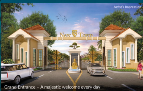
Grand Entrance - A majestic welcome every day