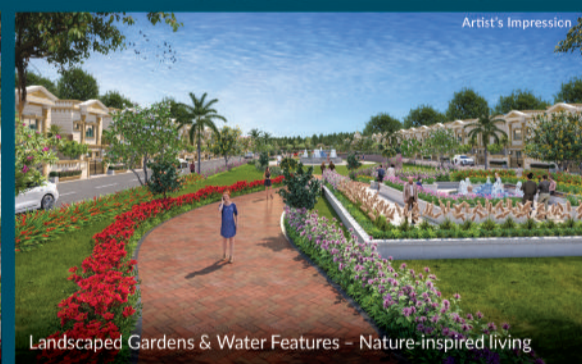
Landscaped Gardens & Water Features - Nature-inspired living