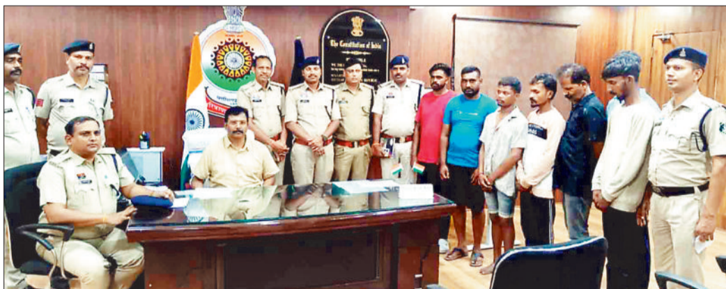
मामले का खुलासा करते एसपी व पुलिस गिरफ्त में आरोपी।

सूरजपुर जिले में पीडीएस दुकानों से लगातार हो रही शासकीय चावल, शक्कर और चना जैसे राशन सामानों की चोरी की घटना होने का पुलिस ने पदों का शक कर खुलासा कर दिया है, पुलिस की गठित विशेष टीम ने एक लाख कीमत का राशन सामान, घटना में प्रयुक्त 3 नग पिकअप वाहन, 2 नग बाइक को पुलिस ने किया जब्त