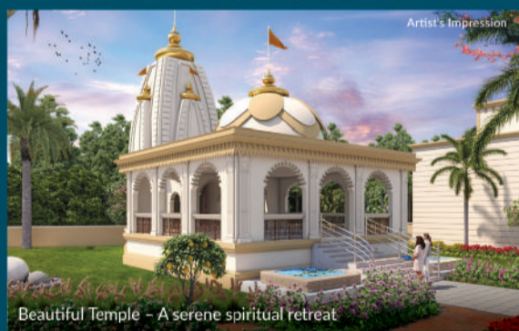
Beautiful Temple - A serene spiritual retreat